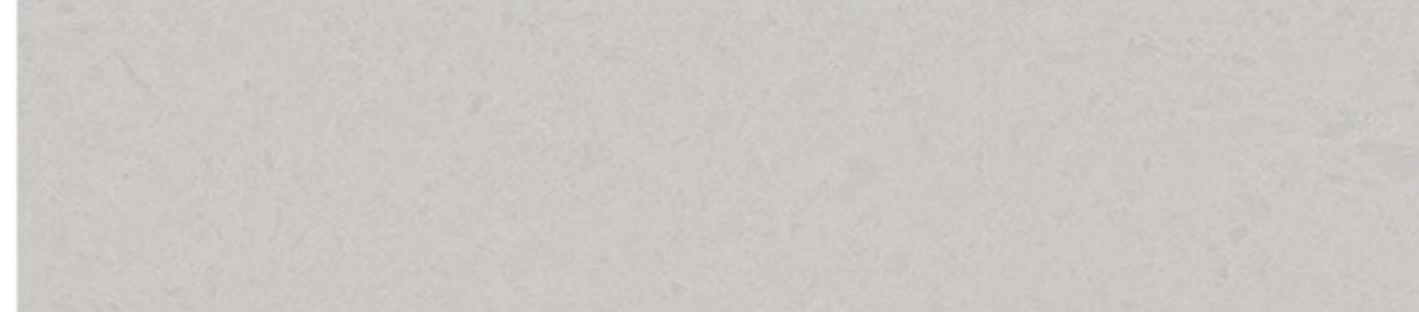
Noble Quarzite | matt