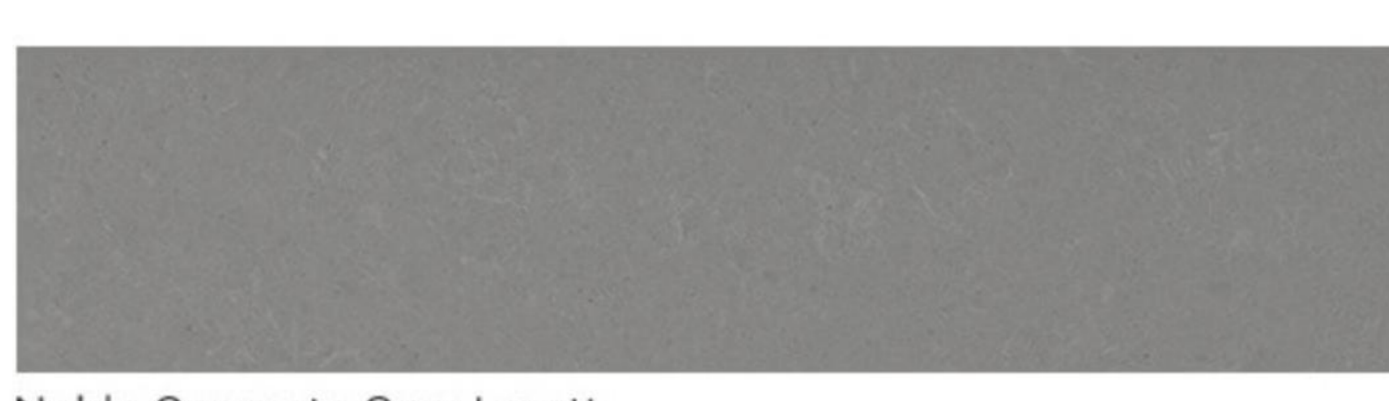
Noble Concrete Grey | matt