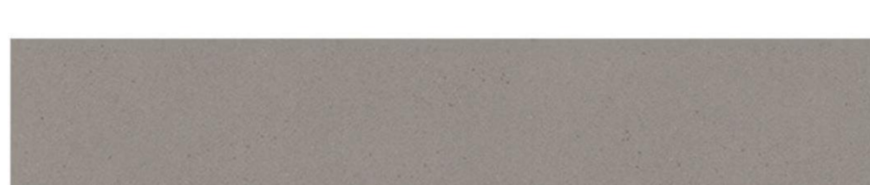
Gobi Urban | matt